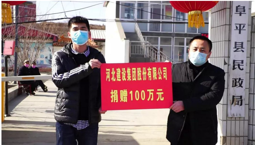
▲2月7日，集团公司向革命老区阜平捐款 100 万元，助力老区打赢疫情防控阻击战。

病毒无情人有情，万众一心战疫情。连日来，新型冠状病毒感染的肺炎疫情牵动着全国人民的心。为抗击疫情，集团公司上下同心，不忘使命，自觉担当，多措并举，在做好自身防控的同时，积极助力各地疫情防控，为各地捐款、捐物总价值达 300 万元。