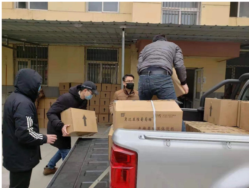
▲安装公司为保定市、清苑区、徐水区等防疫一线捐款、捐物达 20 万元。